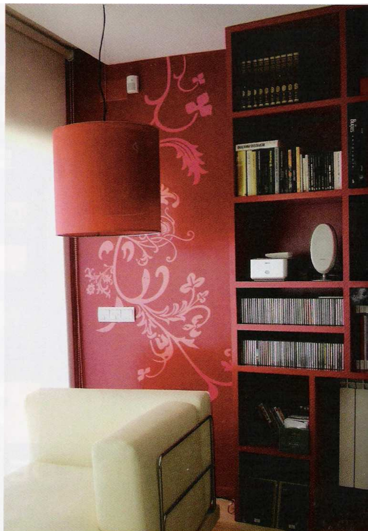
En la imagen de la izquierda, vinilo Antich, de la colección Fauno y en la imagen de la derecha, el diseño llamando Joner de la colección V06, ambos de Flor4u.

lección Ornamental y el "Kukú", de la gama Barroco. Myvinilo.com comercializa vinilos removibles -término con el que resaltan su gran facilidad de aplicación-, con transfer (hoja protectora) y sin transfer, en virtud de la complejidad del modelo.