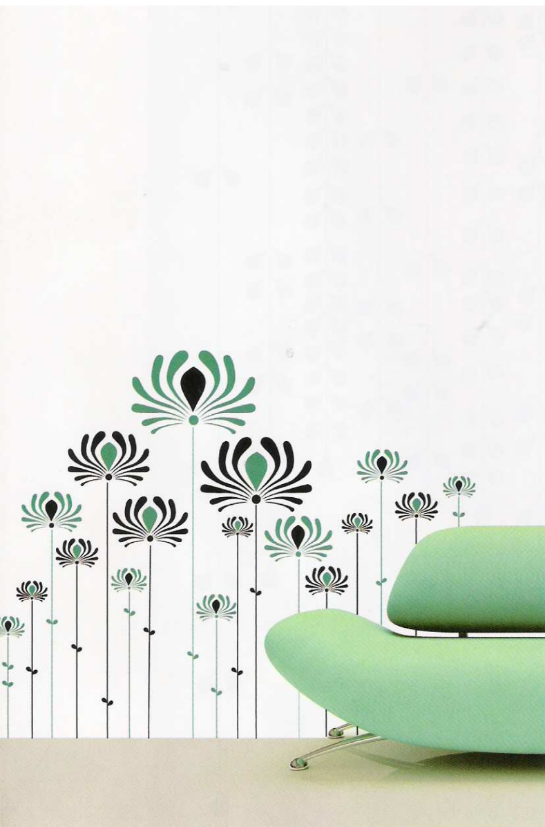
De izquierda a derecha, diseño Mint Forest de Myvinilo y modelo Room 42 de la colección Room 686 de Flor4u.

Los vinilos han revolucionado el universo de la decoración actual. La facilidad y rapidez de su colocación –se adhieren sin problemas a cualquier superficie lisa- y la infinita variedad de sus propuestas, los han convertido en el producto estrella de la temporada. Llega una nueva forma de decorar.